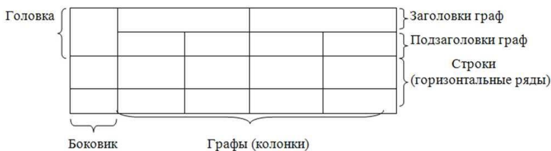
Рисунок 2 – Структурные элементы таблицы

Таблицы имеют свою структуру (рисунок 2)