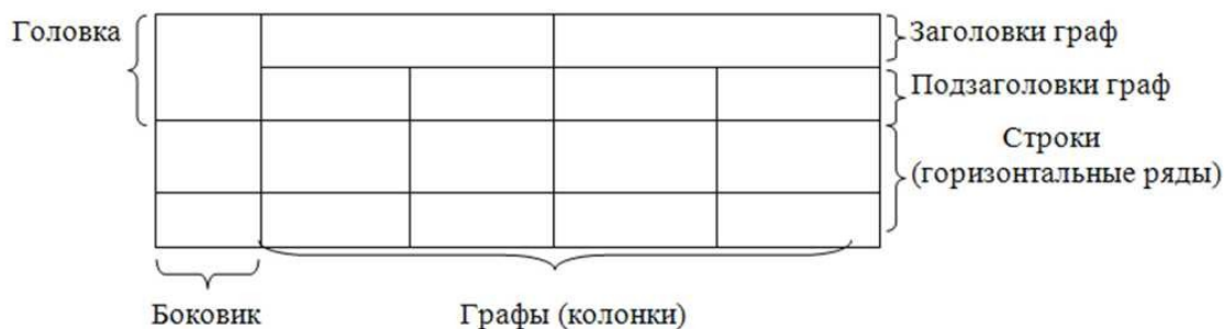
Рисунок 2 – Структурные элементы таблицы

Заголовки граф и строк таблицы следует печатать с прописной буквы, а подзаголовки граф – со строчной буквы, если они составляют одно предложение с заголовком, или с прописной буквы, если они имеют самостоятельное значение.