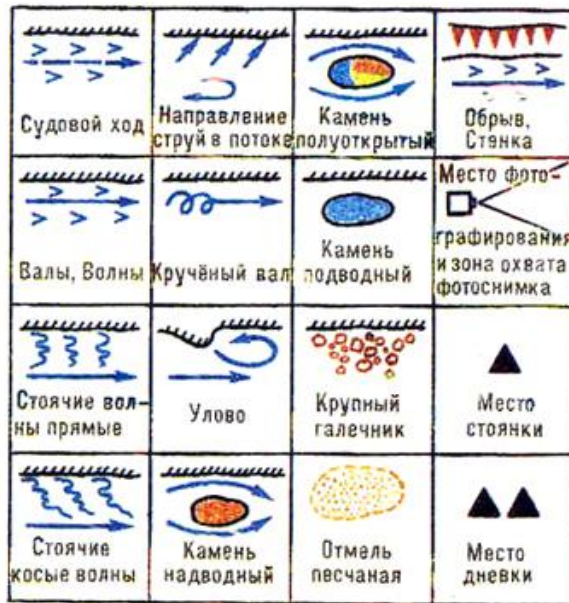
Рис. 1. Условные знаки для составления туристской лоции.

Использую условные обозначения рисунка 1. Составить лоцию реки с нанесением не менее 10 видов препятствий