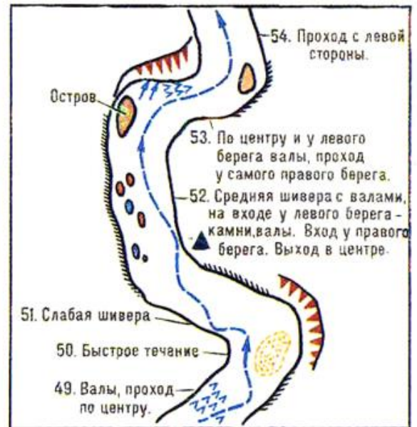
Рис. 2. Туристская лоция участка реки.