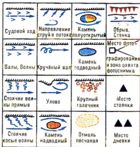
Рис. 1. Условные знаки для составления туристской лоции.

Использую условные обозначения рисунка 1. Составить лоцию реки с нанесением не менее 10 видов препятствий