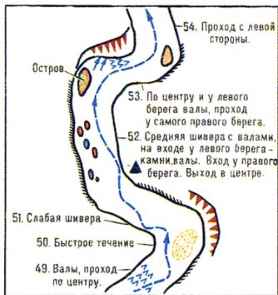
Рис. 2. Туристская лоция участка реки.